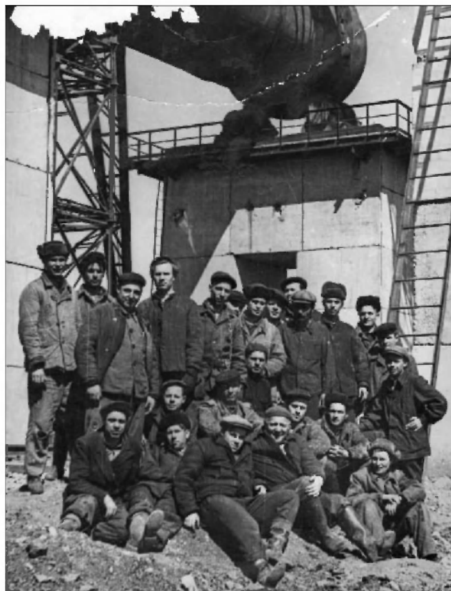
Бригада монтажников на строительстве цементного завода в г. Новоульяновск. 1959 г.