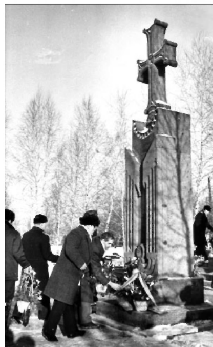
Открытие памятника погибшему экипажу самолета «ИЛ-76» на Ишеевском кладбище в Ульяновском районе Ульяновской области. Январь 1991 г.

вохранению и экологии. 24 декабря 2000 года на очередных губернаторских выборах набрал 23 % голосов и уступил победу генералу Владимиру Шаманову (56 %). В 2002 г. возглавил, учреждённый им фонд помощи социально незащищенным слоям населения «Горячев-фонд». Награждён орденами Дружба народов и Октябрьской Революции, двумя орденами «Знак Почёта», медалями «За трудовую доблесть», «За доблестный труд». В ознаменовании 100-летия со дня рождения В. И. Ленина». Почётный гражданин Ульяновской области.