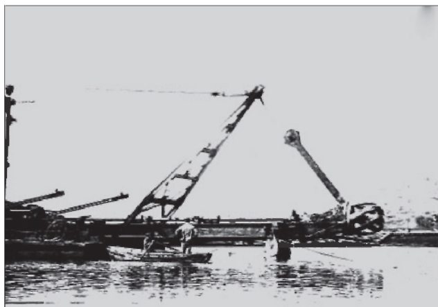
Строительство дамбы. 1950-е гг. Подлинник.

С целью улучшения материального благосостояния жителей области Александр Панкратьевич ставил задачу увеличения масштабов капитального строительства и текущего ремонта жилого фонда. Кроме того, требовалось повсеместное привлечение жильцов к ремонту жилья и уходу за территорией. Неоднократно в своих выступлениях на совещаниях коммунистов А. П. Бочкарев призывал коллег: «Надо в этих случаях поднимать жильцов против нерадивых и требовать от них уважать общественные порядки!» 11 . В послевоенное время наведение порядка требовалось буквально во всем. Обращалось вни-