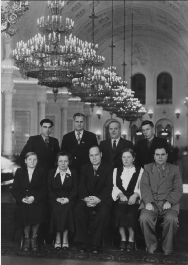
Делегация Ульяновской области на XX съезде. Февраль 1956 г.

тия области. Ульяновск стал одним из крупнейших промышленных центров на Волге.