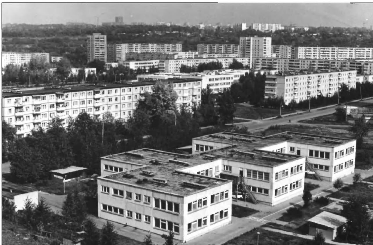
19-й микрорайон г. Ульяновска. Общий вид. Сентябрь 1991 г. ГАНИУО. Ф. 5968. Оп. 1. Д. 1088. Подлинник.

С 1 ноября 1994 г. по 2012 г. — Президент Ульяновской торгово-промышленной палаты. Автор более тридцати научных работ. Избирался Почетным Доктором Международного Европейского Университета, академиком Международной Академии менеджмента, академиком Российской Академии естественных наук. Награжден почетным знаком РАЕН «За заслуги» и высшей наградой РАЕН — «Рыцарь Науки и Искусства». Его имя занесено в национальную энциклопедию личностей Российской Федерации. Награжден Знаком отличия Торгово-промышленной палаты России 2-й степени.