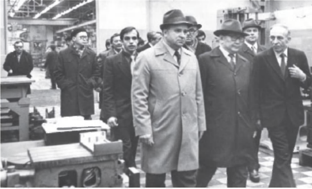
Визит делегации Казахстана на Ульяновский автомобильный завод. 20 апреля 1981 г.