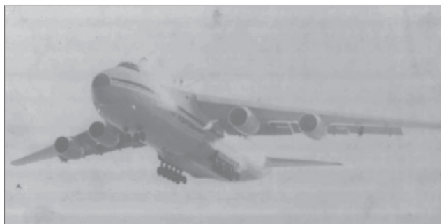
Первый испытательный полёт первого самолёта HA-124 производства УАПК. 30 октября 1985 г.