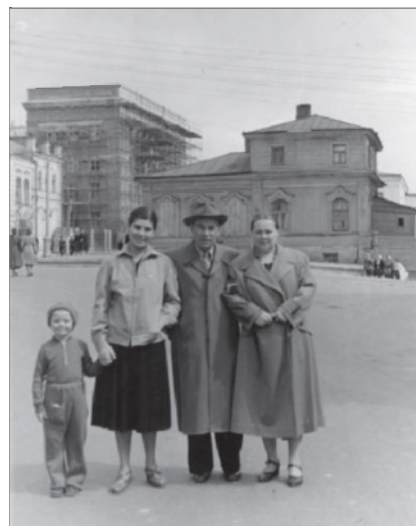
Строительство здания Ульяновского обкома КПСС в г. Ульяновске. 2 мая 1958 г. ГАНИУО. Ф. 6225. Оп. 1. Д. 12. Л. 1. Подлинник.

Особенности внешнеполитической обстановки привели к активному развитию вооружения. СССР (на правах сверхдержавы) приступил к использованию атомной энергии. 15 марта 1956 г. вступило в силу постановление