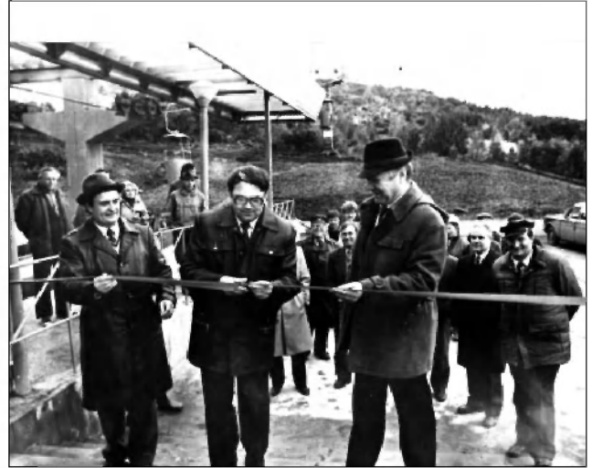
Открытие канатной дороги в парке Дружбы Народов в Ульяновске. 19 сентября 1987 г. ГАНИУО. Ф. 5968. Оп. 1. Д. 913. Подлинник.

новые условия хозяйствования, внедрением коллективных форм организации и стимулирования труда, хозяйственного расчета» 43 . Ю. Г. Самсонов отмечал, что принятая программа «Родина В. И. Ленина – 125» выполняется в замедленном темпе 44 . Главной задачей руководства региона в данной ситуации было недопущение ухудшения положения. В 1989–1990 гг. социально-экономическая комиссия и аппарат социально-экономического отдела обкома старались принимать продуманные меры по передаче функций местным Советам по оперативному управлению промышленностью, транспортом, связью, коммунальным хозяйством, торговлей и потребкооперацией. Вместе с тем происходило серьезное уменьшение инвестиций в промышленность. Для установления деловых контактов по линии ЦК и обкома партии выезжал в Польшу, Вьетнам, Кабо-Верди, Гвинею-Бисау, ФРГ и Бельгию. Поддержание показателей в отраслях народного хозяйства было достигнуто благодаря росту вновь создаваемой стоимости и режиму экономии ресурсов.