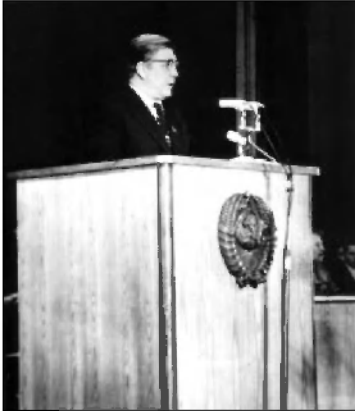
Выступление Первого секретаря обкома партии, кандидата в депутаты Верховного Совета СССР И. М. Кузнецова перед избирателями р.п. Новоспасское. Февраль 1979 г. ГАНИУО. Ф. 5968. Оп. 1. Д. 719. Подлинник.