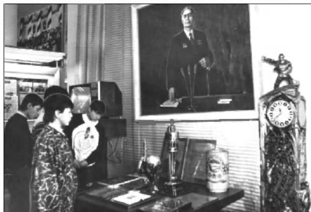
Выставка «От политического единomyслия к плюрализму» в зале филиала Центрального музея В. И. Ленина в Ульяновске.

зерна за пределами области. Ю. Ф. Горячев отмечал, что Ульяновская область оказалась в серьезной экономической яме в силу нарушения экономической связи, отсутствия материального обеспечения 47 .