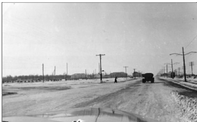
Открытие движения трамвая в Железнодорожный район Ульяновска. 1957 г. ГАНИУО. Ф. 5968. Оп. 1. Д. 504. Подлинник.

Совета Министров СССР о строительстве опытной станции по испытанию ядерных реакторов в городе Мелекесс, ставшего филиалом Курчатовского института атомной энергии.