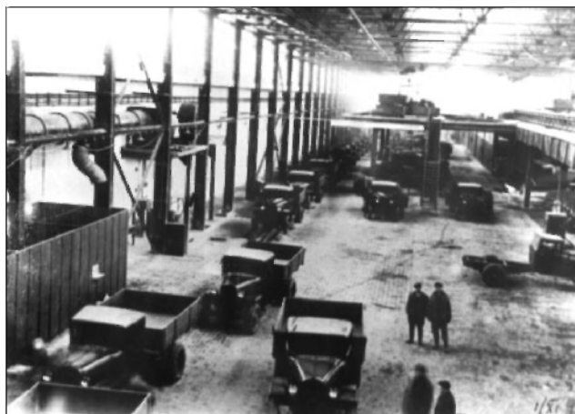
Главный конвейер Ульяновского автомобильного завода. 1947 г. ГАНИУО. Ф. 5968. Оп. 1. Д. 473. Подлинник.