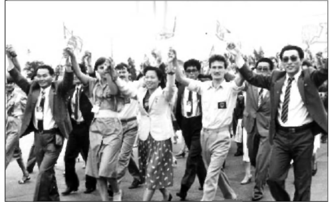
Участники торжественных мероприятий, посвященных проведению I фестиваля дружбы молодежи СССР – КНДР на площади 30-летия Победы в Ульяновске.

охранной зоны, исторического заповедника «Родина В. И. Ленина», как единого комплекса памятных Ленинских мест, памятников истории и культуры, их исторической среды, как своеобразного градостроительного памятника внутри развивающегося города с последующим пересмотром функциональной роли некоторых зданий и сооружений для одновременного обслуживания экскурсантов, туристов при сохранении жилой среды вокруг памятников. В июле 1984 г. был открыт Ульяновский государственный университет. Геннадий Васильевич был убежден, что открытие нового высшего учебного заведения даст новую возможность для восполнения недостающих специалистов, а также поднимет роль Ульяновска в деле пропаганды ленинизма и сохранения наследия В. И. Ленина. В марте 1985 г. Колбин говорил о необходимости реконструкции зала драматического театра: «На балконах люди смотрят как из «амбразур», ложи разделены фанерными щитами, для опор использована металлическая арматура, темные тона покраски сочетаются с плюшевыми шторами на дверях. Коряво оформленный подвесной потолок усиливает общее омрачение фона. Все это оставляет впечатление провинциализма. Надо восстановить всю прелесть классических театральных форм: и гипс, и светлые тона, люстра и бра, т.е. все то, что создает атмосферу уюта...» 38 .