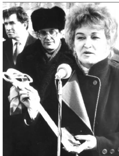
Открытие Дворца бракосочетания в Ульяновске. Март 1988 г.