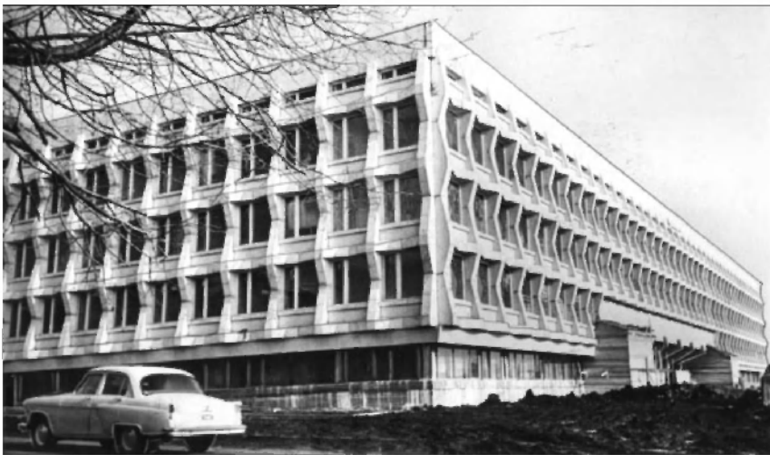
Новое здание Ульяновского государственного педагогического института. ГАНИУО. Ф. 5968. Оп. 1. Д. 593. Подлинник.

ввода в эксплуатацию новых зданий Научно-исследовательского института атомных реакторов. С 1957 г. в регионе происходил процесс газификации. В целях ускорения газификации Ульяновска и Мелекесса, в особенности Ульяновского цементного завода, промышленный обком форсировал введение в действие газопровода Улешовка-Мелекесс — Ульяновск в 1964 г. Было расконсервировано строительство нового