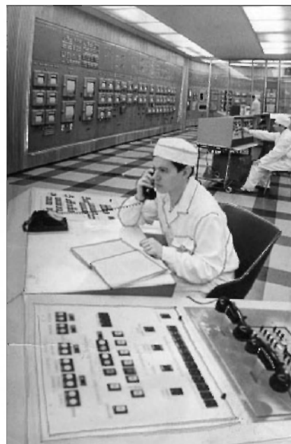
Пульт управления опытного атомного реактора на быстрых нейтронах.1970 г. ГАНИУО. Ф. 5968. Оп. 1. Д. 1867. Подлинник.

ласть, города Ульяновск и Димитровград, Чердаклинский район и отдельные трудовые коллективы были награждены Памятными знаками «За трудовую доблесть в девятой пятилетке» и переходящими Красными знаменами ЦК КПСС, Совета министров СССР, ВЦСПС и ЦК ВЛКСМ, Красными знаменами Совета Министров РСФСР и ВЦСПС. За успешное освоение выпуска автомобилей новых моделей и досрочное выполнение заданий девятого пятилетнего плана вторым орденом Трудового Красного Знамени награжден Ульяновский автомобильный завод. Орденом «Знак Почета» за большие успехи в выработке продукции, осуществление технического перевооружения и повышения эффективности производства – Ульяновский цементный завод. Награждены орденами и медалями 6700 передовиков промышленности и сельского хозяйства, шестерым присвоено звание Героя Социалистического Труда.