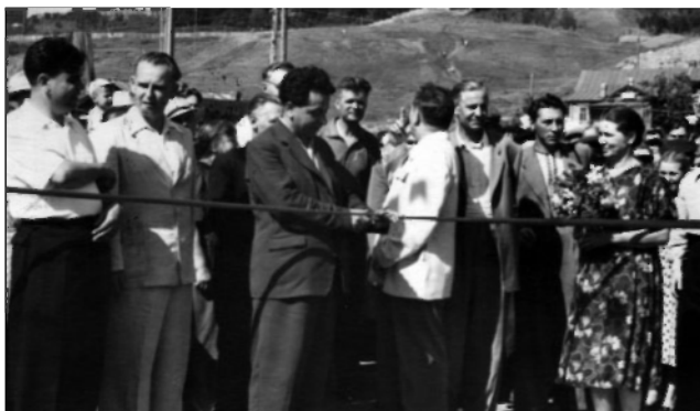
Открытие автомобильного моста через Волгу в г. Ульяновске. Август 1958 г.

связи. В период работы Ивана Дмитриевича с согласия Министерства связи СССР было осуществлено дооборудование линии для передачи московских телевизионных программ 18 . 12 августа ко Дню строителей в Ульяновске было закончено строительство автотранспортного моста через Волгу. Современники отмечали, что это было огромным событием для города и области. В ноябре 1959 г. вступил в строй действующий телевизионный центр в Ульяновске. Началось и шло полным ходом строительство цементного завода в Новоульяновске.