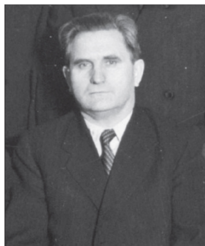
Иван Дмитриевич Яковлев

В 1959 г. было закончено строительство и введено в эксплуатацию радиорелейная магистраль Москва- Куйбышев, используемое только для телефонной