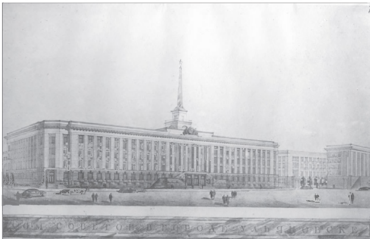
Нереализованный проект Дома Советов в г. Ульяновске. 1947 г. ГАНИУО. Ф. 5968. Оп. 2. Д. 19. Л. 1.

ма) СССР, где работал вплоть до ликвидации политотделов. В 1943–1944 гг. учился в Высшей школе парторганизаторов при ЦК ВКП(б). В Ульяновск на должность первого секретаря обкома ВКП(б) был переведён из Куйбышевской области, где до этого на протяжении двух лет занимал пост председателя исполнительного комитета областного Совета.