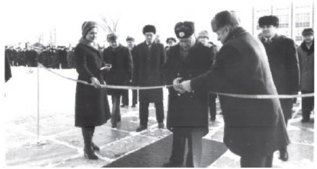
Открытие пусковых объектов 1-ой очереди Центра ГА СЭВ в Ульяновске. В центре 1-й – заместитель Министра ГА СССР А. И. Назаров. 8 февраля 1983 г.

фикации непосредственно на месте его сооружения. Предварительные расчеты показали, что в ближайшие 5 лет потребность Ульяновского авиакомплекса в специалистах V группы «Машиностроение и приборостроение» составит свыше 800 чел., а «Самолетостроение» — 300 чел. Иван Максимович ходатайствовал перед Министром Высшего и среднего специального образования СССР В. П. Елютиным об открытии в Ульяновском политехническом институте специальности «Самолетостроение» 35 . Приказом Министра гражданской авиации СССР от 8 сентября 1980 г. Ульяновская ордена Ленина школа высшей подготовки с учебно-методическим Центром гражданской авиации с 1 января 1981 г.) была преобразована в Центр совместного обучения летного, технического, диспетчерского персонала гражданской авиации стран СЭВ.