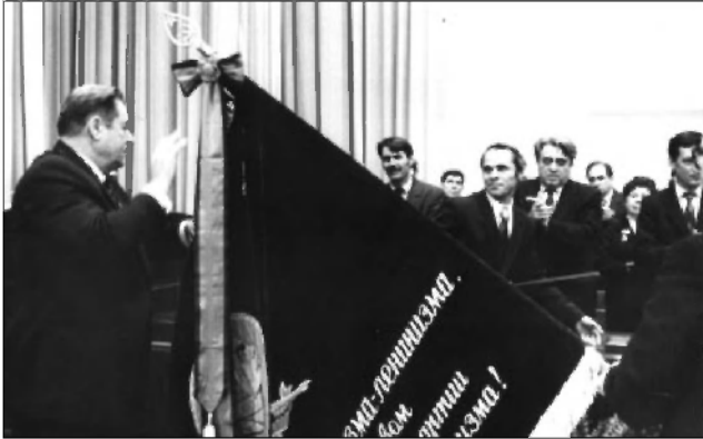
Вручение Ульяновскому домостроительному комбинату Ордена Трудового Красного Знамени в Большом Зале Ленинского Мемориала. ГАНИУО. Ф. 5968. Оп. 1. Д. 836. Подлинник.