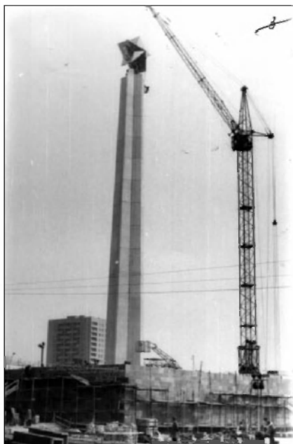
Строительствоobeliska Славы в г. Ульяновске. 1975 г. ГАНИУО. Ф. 5968. Оп. 1. Д. 677. Подлинник.