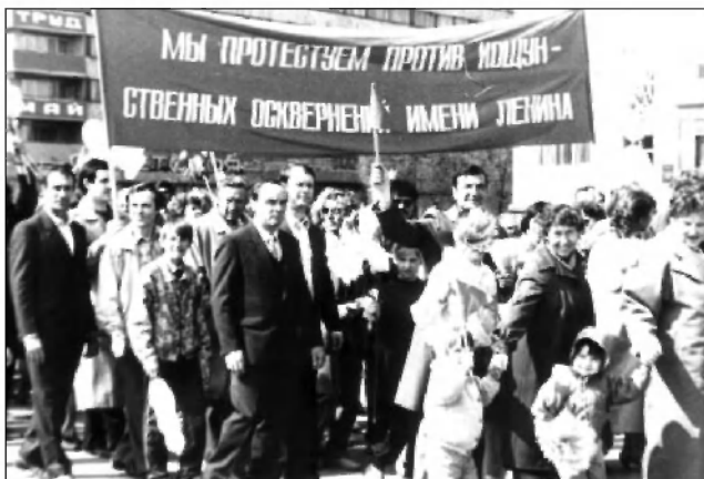
Группа участников демонстрации, посвященной празднованию 1 Мая на площади В. И. Ленина. 1 мая 1990 г. ГАНИУО. Ф. 5968. Оп. 1. Д. 913. Подлинник.