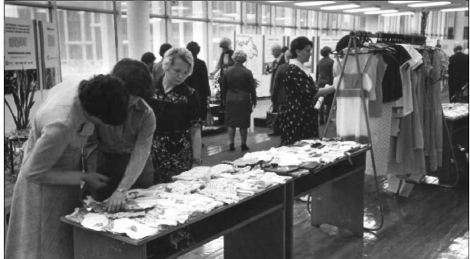
Выставка товаров, производимых чулочно-трикотажной фабрикой им. КИМ во время VII отчетно-выборной партийной конференции в Ленинском Мемориале. Ноябрь 1980 г. ГАНИУО. Ф. 5968. Оп. 1. Д. 738. Подлинник.

гической очисткой, водозаборные сооружения на 25 тыс. метров кубических в сутки, 185 км высоковольтных и кабельных линий; 75 км магистральных водопроводов и канализационных коллекторов, автомобильные, железные дороги и другие объекты. Значительная работа была проведена в сфере газификации области. К 1980 г. протяженность газовых сетей составила 257,3 км против 54,3 км в 1970 г. Число газифицированных квартир увеличилось до 284,9 тыс. За эти годы на промышленных предприятиях области освоено производство новых видов продукции почти четырех тысяч наименований. Энерговооруженность труда в 1980 г. по сравнению с 1970 г. возросла на 44 %.