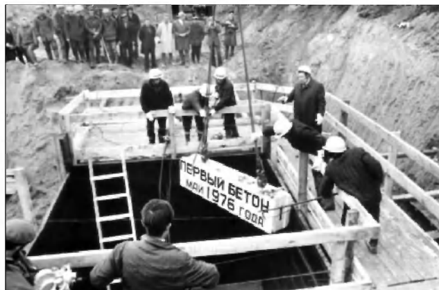
Закладка Ульяновского авиационно-промышленного комплекса. Май 1976 г. ГАНИУО. Ф. 5968. Оп. 1. Д. 671. Подлинник.