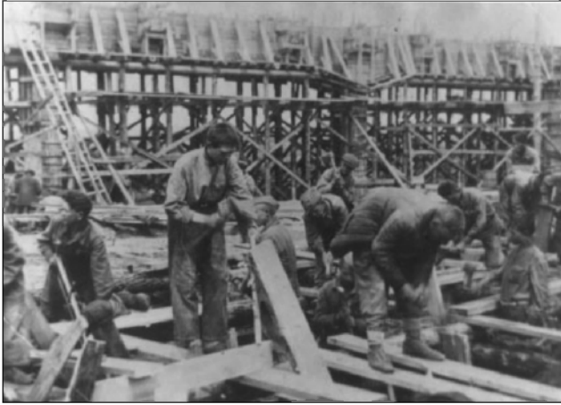
Строительство опалубки Ульяновского автомобильного завода. 1944 г.