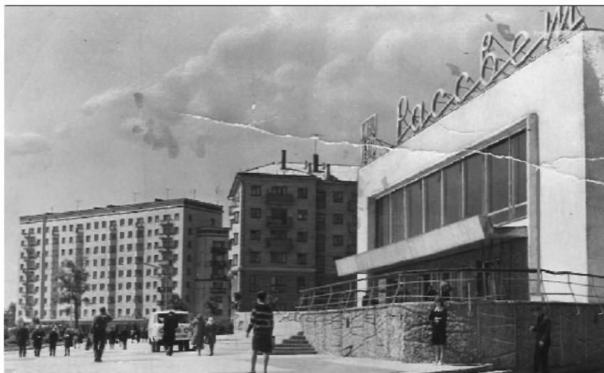
Широкоформатный кинотеатр «Рассвет» в г. Ульяновске, открытый в 1964 г.